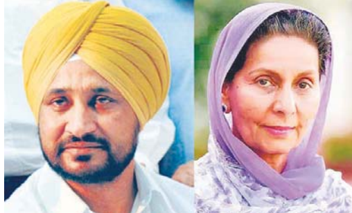
ਮੁਲਾਕਾਤ ਕੀਤੀ ਹੈ। ਸਿਆਸੀ ਪਹਿਲੀ ਮੀਟਿੰਗ ਸੀ, ਅਤੇ ਉਸ ਦੀ ਧੀ ਪਹਿਲੀ ਮੀਟਿੰਗ ਸੀ ਤੋਂ ਅਗਲੀਆਂ ਚੋਣਾਂ ਲੜਨ