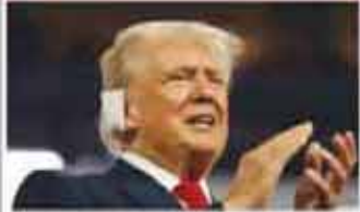
ਟਰੰਪ ਨੂੰ ਹਮਲਾ ਕਰਨ ਵਾਲੇ ਵਿਅਕਤੀ ਨੂੰ ਚਾਕੂ ਲਹਿਰਾਉਂਦੇ ਵੇਲੇ ਢੇਰ ਕੀਤਾ ਗਿਆ।

ਕਨਵੈਨਸ਼ਨ ਸੈਂਟਰ ਦੇ ਬਾਹਰ ਪੁਲਿਸ ਨੇ ਚਾਕੂ ਲਹਿਰਾਉਂਦੇ ਵਿਅਕਤੀ ਨੂੰ ਕੀਤਾ ਢੇਰ, AK-47 ਬਰਾਮਦ