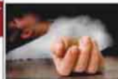
ਚਾਕੂ ਲਹਿਰਾਉਂਦੇ ਵਿਅਕਤੀ ਨੂੰ ਢੇਰ ਕੀਤਾ ਗਿਆ।

ਚਿੰਨ: ਮਸ਼ਹੂਰ ਨਜ਼ਦੀਕ ਗੋਲੀਬਾਰੀ ਦੌਰਾਨ 1 ਭਾਰਤੀ ਔਰਤ 6 ਦੀ ਮੌਤ