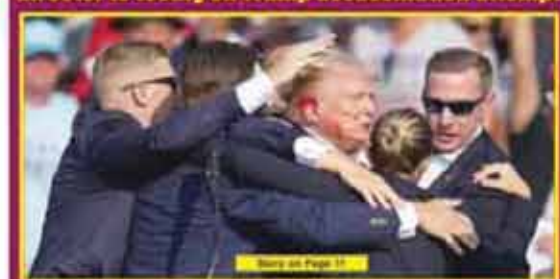
House Oversight panel subpoenas Secret Service director to testify on Trump assassination attempt