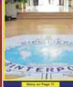
Interpol arrests 300 people in a global crackdown on West African crime groups