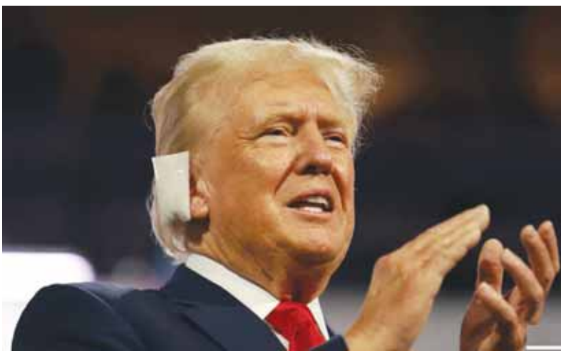
ਮਿਲਵਾਕੀ : ਹਾਲ ਹੀ ਵਿੱਚ ਅਮਰੀਕਾ ਵਿੱਚ ਸਾਬਕਾ ਰਾਸ਼ਟਰਪਤੀ ਡੋਨਾਲਡ ਟਰੰਪ 'ਤੇ ਗੋਲੀ ਚਲਾਈ ਗਈ

ਕਨਵੈਨਸ਼ਨ ਸੈਂਟਰ ਦੇ ਬਾਹਰ ਪੁਲਿਸ ਨੇ ਚਾਕੂ ਲਹਿਰਾਉਂਦੇ ਵਿਅਕਤੀ ਨੂੰ ਕੀਤਾ ਢੇਰ, AK-47 ਬਰਾਮਦ