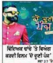
ਵਿਦਿਅਕ ਚਾਂਚੇ 'ਤੇ ਵਿਅੰਗ ਕਰਦੀ ਫਿਲਮ 'ਦੋ ਦੂਟੀ ਪੰਜ'

Vol. 14 Issue 15 Wednesday 02 Jan to 08 Jan, 2019 www.PUNJABI DUNIYA.com Published Weekly from New York