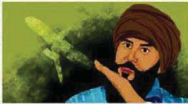
ਨਵੇਂ ਸਾਲ ਮੌਕੇ ਅਮਰੀਕੀ ਫੌਜ ਨੇ ਬਬ ਦਾ ਟਵੀਟ ਕਰਨ ਲਈ ਮੰਗੀ ਮੁਆਫ਼ੀ